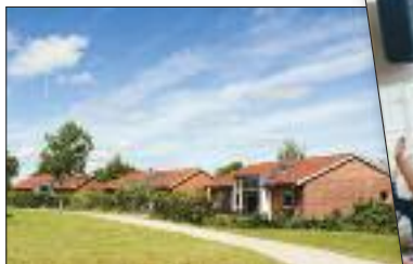
Vi bor meget forskelligt